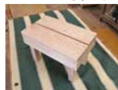
ミニいす 材料費：600円 (30cm×19cm×19cm)