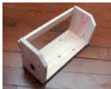
本立て 材料費：400円 (30cm×12cm×15cm)