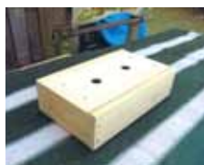
道具箱 材料費：400円 (25cm×15cm×7cm)