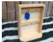
キーボックス 材料費：600円 (22cm×4cm×25cm)