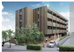
チャームスイート神戸北野