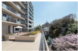
ライフ&シニアハウス神戸北野