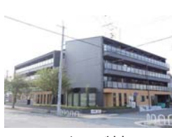
リハビリング神戸西