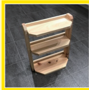
小物棚(3段) 材料費: 700円 (25cm×10cm×30cm)