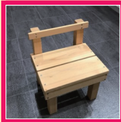
ミニいす 材料費: 700円 (25cm×25cm×30cm)