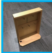
キーボックス 材料費: 600円 (22cm×4cm×25cm)