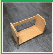
本立て 材料費: 400円 (30cm×12cm×15cm) ( )内は、(幅×奥行き×高さ)のおおむねの大きさです。