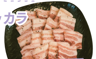
サムギョプサル 2,600円(2人前)