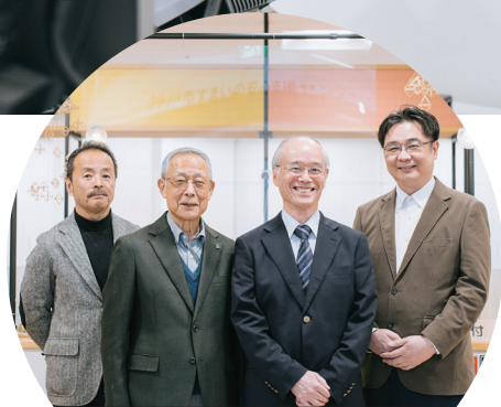
わたしたちがお手伝いします！

A マンション管理を行わず建物の劣化を放置していると、雨漏りや配管からの水漏れなどマンションのトラブルにつながります。そのため、定期的に点検を行うなどきちんと管理する必要があります。