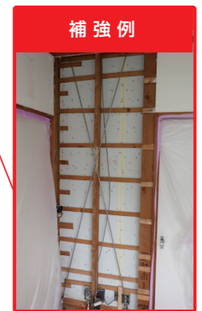
補強例 ステンレス製補強金物 壁をステンレス製補強金物で補強しました。