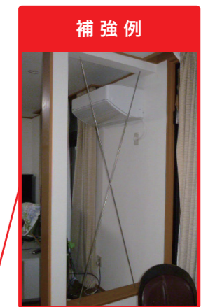
補強例 露出仕上げ 部屋を広く見せるため、柱と筋交いを露出した補強を行いました。