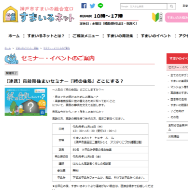
すまいるネットホームページ セミナーの案内